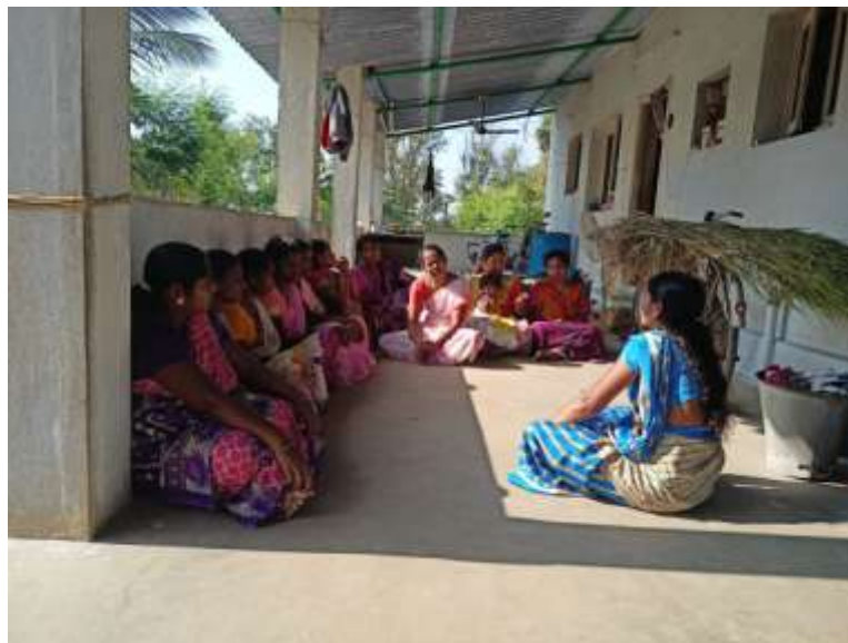
Imaxe 1: Xuntanza dun grupo de Axuda Mutua en Salem (2023)