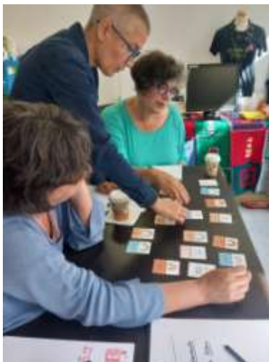
Imaxe 2: Xunta Directiva durante a xornada de formación interna.

As asistentes valoraron moi positivamente esta xornada. Por una banda, describiron a formación como dinámica e moi didáctica; pola outra, concluíron que se trata dunha formación moi necesaria para entender e coñecer as accións emprendidas en todos estes anos e profundizar na filosofía da organización.