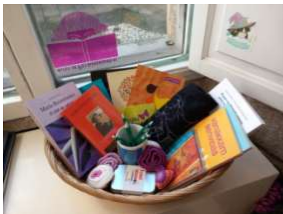
Imaxe 3: Cesta Solidaria con motivo do 8 de marzo.