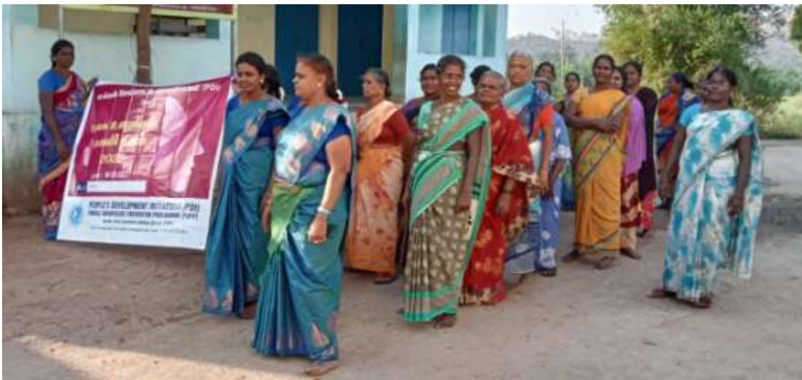
Imaxe 4: Marcha das mulleres dos GAM en conmemoración do día Internacional da Eliminación da Violencia contra as Mulleres.

O programa cre que o empoderamento das mulleres é a única ferramenta para eliminar todas as formas de violencia contra as mulleres, incluído o infanticidio e o feticidio feminino.